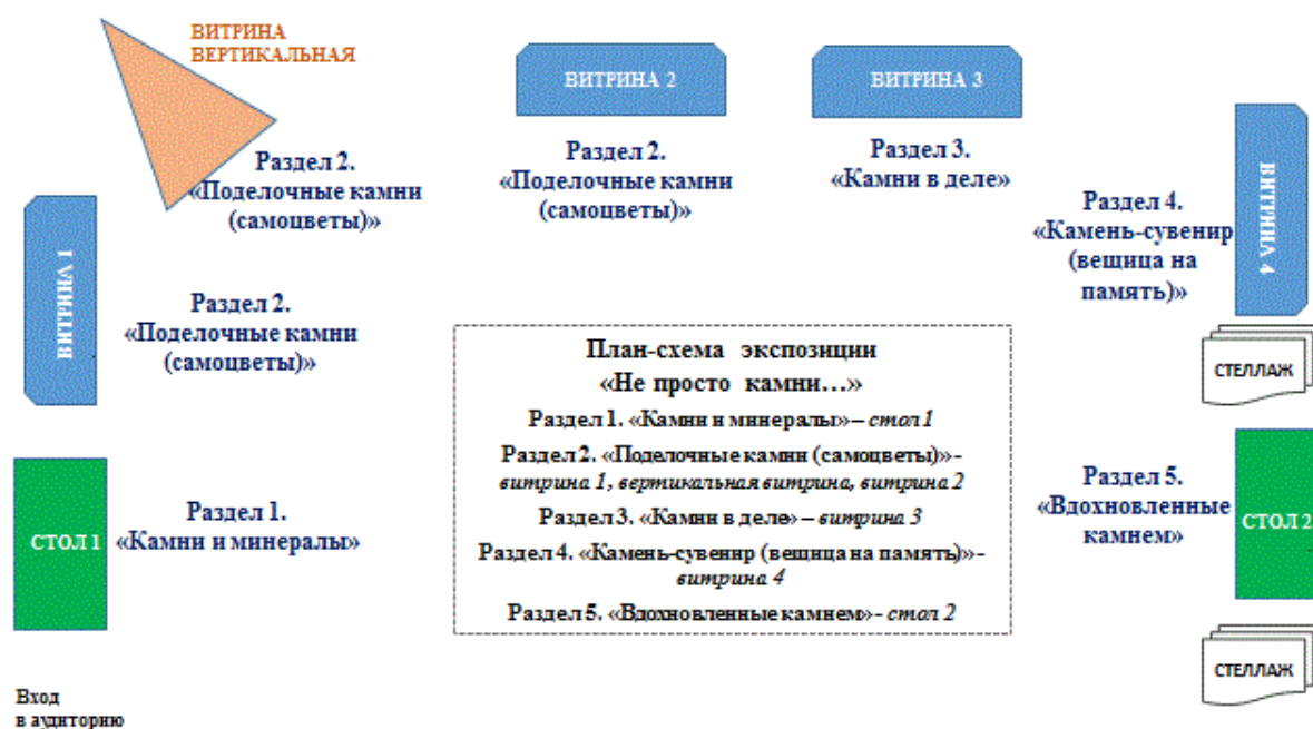
Рис. Вариант оформления плана-схемы экспозиции

- этикетаж в случае необходимости его дополнительного дуближа.